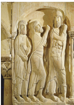
Les pèlerins d'Emmaüs et le Christ, pèlerin de Compostelle, abbaye de Silos, Espagne

Comme tous les ans, l'ISTR propose une session pastorale. Ces sessions se proposent d'analyser, de décrypter l'expérience spirituelle et pastorale que vivent des croyants quelques soient les situations. Cette année, nous nous interrogerons sur l'aventure que vivent les pèlerins :